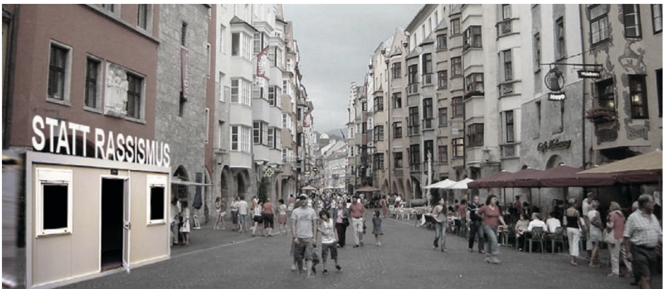
Möglicher Ort für die Containerinstallation in Innsbruck (Symbolfoto), Dauer: 5 Tage im Oktober 2010)

Das Projekt "Statt Rassismus" versucht der Normalität von Rassismus eine andere Wirklichkeit entgegenzusetzen. In dem Projekt wird an einer Gesellschaft ohne Rassismus gearbeitet und es werden Entwürfe, wie eine solche Gesellschaft aussehen könnte, zur Diskussion gestellt.